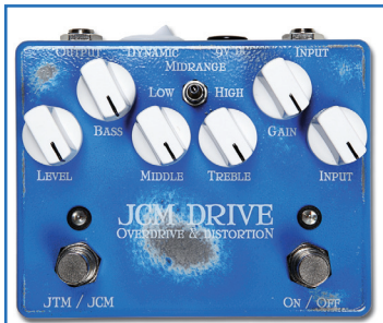
WEEHBO 商品番号: 2573 "JCM DRIVE" ¥36,750 (税抜価格¥35,000)

幅広い多用性を誇るペダル・ディストーション。ロー&ミディアムゲインからハイゲインまで、クラシカルなソフト・ディストーションからモダンなハード・ディストーションまで、多彩な歪みをクリエイトします。絶妙にチューニングされたアクティブ4バンドEQにより、ライト・ディストーションでも超爆音でも、ハイは耳障りにならず輪郭はボヤけません。LO&HIGHの"MIDRANGE"トグルスイッチは、中音域を効果的にシェイプし、歪み音の濁みを解消するのに効果絶大。また、ハイエンドとローエンドの厚みを切り替える"RHYTHM/LEAD"フットスイッチを搭載。駆動電圧を9Vから18Vに昇圧する"DYNAMIC"スイッチも、レキシルティの向上に役立っています。