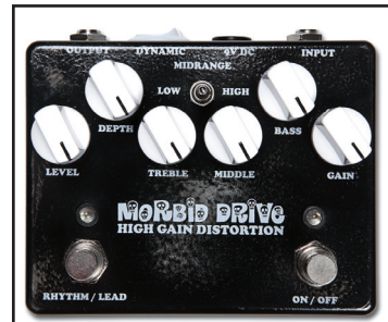
WEEHBO 商品番号: 2572 "MORBID DRIVE" ¥36,750 (税抜価格¥35,000)

「プレキシ・トーン」をターゲットにしたクラッシュ~ローゲイン・オーバードライブ。"GAIN"スイッチにより、歪みの上限を2種類に切り替え可能。最大値でフルドライブさせたサウンドは、フル10にセットしたマーシャルのもの。"TONE"と"PRESENCE"は、ミッド~ハイをシェイプするのみならず、歪みの輪郭とキャラクターをコントロール。個別にON/OFF可能なブースター・パートは、基本的にはクリーンブーストですが、ドライブ・パートのゲインを上げるにつれ、気持ちのいい濁りとコンプ感が加わって行きます。また、DYNAMIC"スイッチで駆動電圧を9Vから18Vに昇圧すれば、よりワイドなサウンドレンジが得られます。