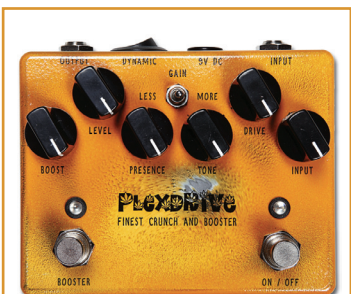
WEEHBO 商品番号: 2571 "PLEXDRIVE" ¥36,750 (税抜価格¥35,000)

ダイナミックな表現力と多用性を両立させたロー~ミディアムゲイン・オーバードライブ。あらゆるプレイスタイル・テクニクに対応し、ギター本来のキャラクターを生かきと際立たせます。その音色は、中音域が豊かでやや濁ったプリティッシュ・ロック・サウンドがターゲット。ブースター・パートは単独でもON/OFFでき、"BOOSTER"スイッチにより、オーバードライブ・パートの前段にも後段にも接続可能です。また、駆動電圧を9Vから18Vに昇圧する"DYNAMIC"スイッチを搭載。さらに各種コントロールノブに加えて内部トリマーを装備し、ギタリストの嗜好に合わせた幅広いセッティングを実現しています。