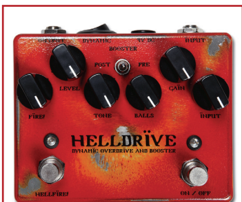
WEEHBO 商品番号: 2570 "HELLDRIVE" ¥36,750 (税抜価格¥35,000)

ハンドメイド・ギターアンプの最高峰とも言われるDumbleのOverdrive Specialをターゲットにした、ライト~ミディアムゲイン・オーバードライブ。ゲイン回路は2チャンネル構成。初段のチャンネル1では"DRIVE"が歪みをコントロールし、原音を甘く大きく際立たせたクリーンブースト~ナチュラルオーバードライブサウンドを。"SELECT"オンでLEDを点灯させれば、チャンネル2が作動。"MORE"、"DRIVE"がどちらも機能し、更に深い歪みが得られます。ゲインレベルの大小に関わらず、漆を塗ったように艶やかなその音色は、Dumbleサウンドそのもの。狙った音域を効果的にカット&ブーストする3バンドアクティブEQと、"MIDDLE"コントロールが調節する周波数域を切り替える"Mid Freq"スイッチが、音割りの幅を広げます。深い表現力を持つ上級プレイヤーに、最上級のアンプでぜひ試して欲しいペダルです。