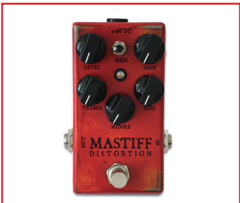
WEEHBO 商品番号: 2575 "MASTIFF" ¥31,500 (税抜価格¥30,000)

深い歪みとパンチあるローエンドが特徴の、ミディアム~ハイゲイン・ディストーション。複数のゲインステージとレンジの広いアクティブ・3バンドEQを効果的に組み合わせる事により、アグレッシブでぶ厚いボトムの、モダンなディストーション・サウンドを発生させます。圧倒的なゲイン感を誇りつつも、音は透明感に溢れ、レスポンスはピッキングに極めて忠実。また、ミッド~ハイの成分を増減する"VOICE"スイッチを装備し、より豊富なサウンドバリエーションを獲得しています。