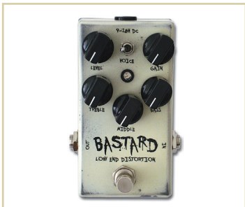
WEEHBO 商品番号: 2574 "BASTARD" ¥31,500 (税抜価格¥30,000)

極めて多彩なドライブ・トーンをクリエイトする、ロー~ミディアムゲイン・オーバードライブ。マーシャルJTMの1960年代風サウンドとJCMの70年代風サウンドを、フットスイッチを踏むだけで切り替え可能。アクティブ3バンドEQはパワフルなロックサウンドに最適化され、"MIDRANGE"トグルスイッチは中音域を調整し、音の濁みを排除します。ソフトなディストーションから、鳴き叫ぶようなハイとぶ厚いボトムのハードドライブまで、幅広いゲインをコントロール。また、DYNAMIC"スイッチで駆動電圧を9Vから18Vに昇圧すれば、よりワイドなサウンドレンジが得られます。