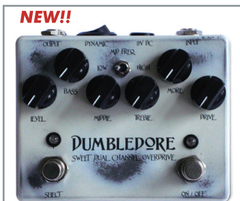
WEEHBO 商品番号: 2577 "DUMBLEDORE" ¥36,750 (税抜価格¥35,000)

1980~90年代ハード&メタルの象徴である SoldanoのSuper Lead Overdrive-100のサウンドをターゲットにした、オーバードライブ/ディストーション。極めてパワフルながらニュアンス豊かできめ細かい、SLOサウンドの魅力、忠実に再現しています。ゲイン回路は"Crunch"と"Overdrive"の2チャンネル構成。"Select"スイッチの切り替えで、チューブライクでナチュラルな歪みの"Crunch"に"Overdrive"が追加され、一段とハーモニクスとゲイン感が豊かなディストーションサウンドを発生させます。内部トリマーによりロー~ミッドの可変幅を調節可能な3バンド・アクティブEQも、狙ったトーンレンジを効果的にカット&ブースト。また、"MIDDLE"ノブがコントロールする周波数域を切り替える"Mid Freq"スイッチは、音スケの向上やアンサンブル中でのサウンドバランスの調整に効果的です。