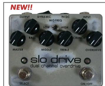
WEEHBO 商品番号: 2576 "slo drive" ¥36,750 (税抜価格¥35,000)

ヴェーボ・エフェクテ (WEEHBO Effekte) は、2008年にドイツのハノーヴァーで起業したエフェクトペダル・ブランドです。全ての製品は最高品質のパーツをチョイスし、全ての行程を1人のビルダーが責任を持ってハンドメイド生産しています。ペダル開発のコンセプトは第一に多用性、第2に真空管アンプの個性を再現すること。理想の製品を目指してあらゆる回路デザインをテストし続けた成果が、「ダイナミック・スイッチ」や「インテグレートド・ブースター」などのユニークな機能。もちろん、全ての製品はトゥルーバイパス仕様。あえて使い古されたようなレリック処理を施した、ヴィンテージ感溢れるペイントも魅力です。